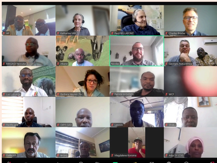
Quelques uns des participants à la quatrième session du Comité de Pilotage PAPFor du 12 décembre 2024