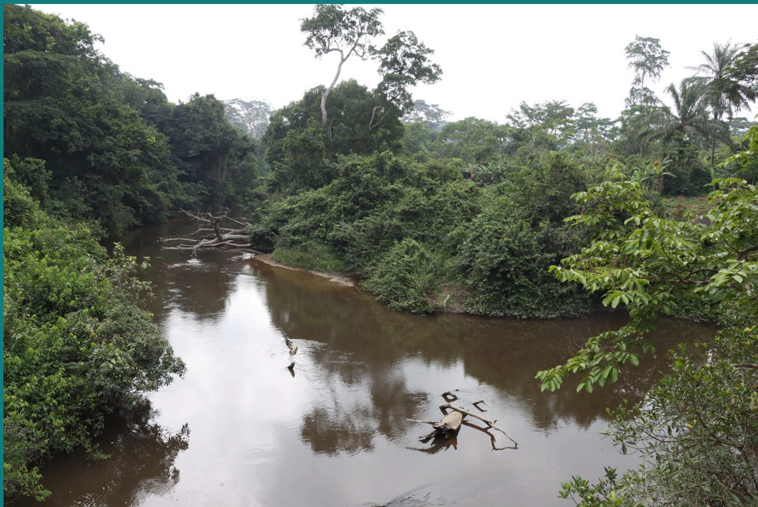
Rivière dans le corridor entre les zones protégées proposées de Wologizi (Libéria) et Wonegizi (Guinée)

🎉 ✨ Meilleurs vœux pour les fêtes de fin d'année, santé et prospérité pour 2025 ✨ 🎉